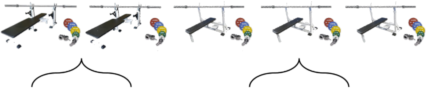
2 bancs de développé couché handisport